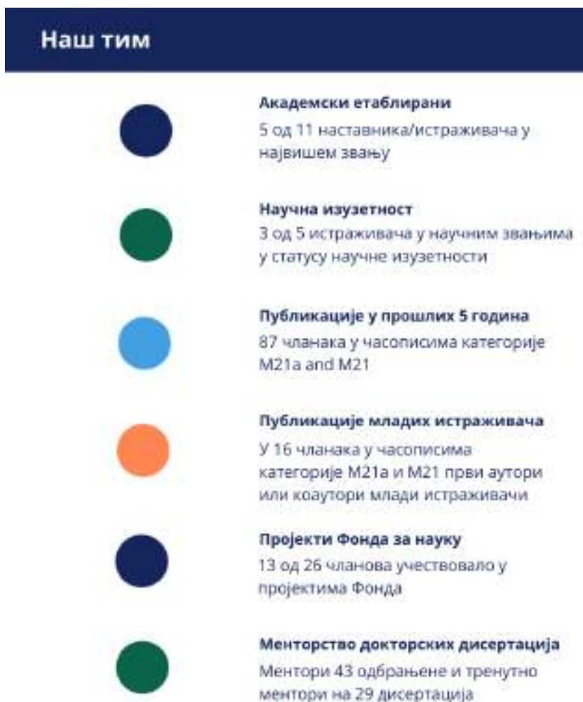
Слика 1 Постигнућа истраживачког тима у протеклих пет година