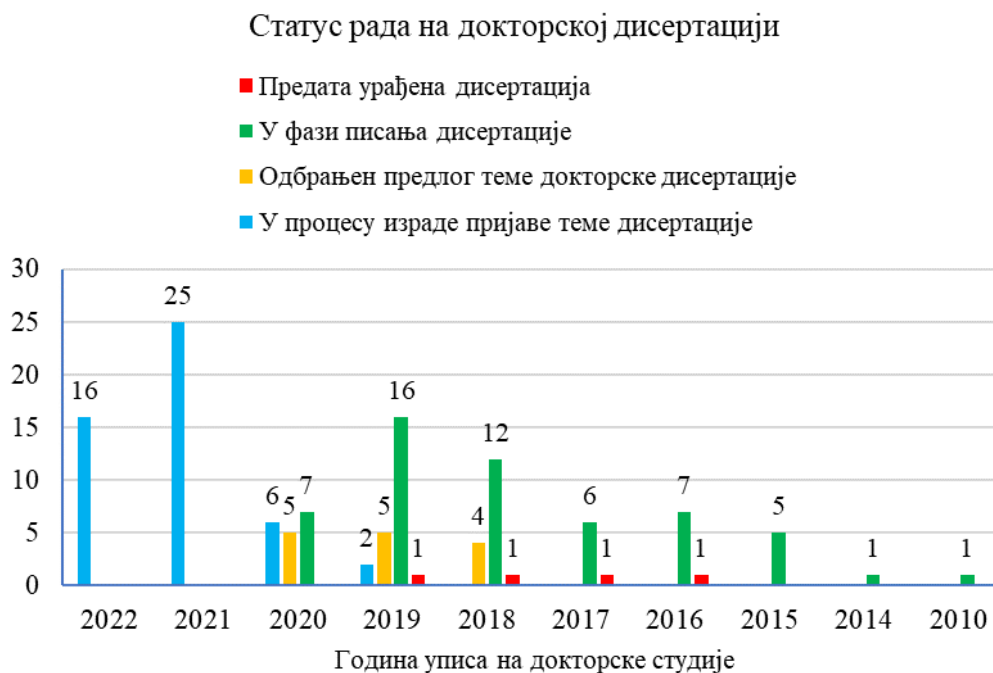
График 1. Број кандидата у свакој од фаза рада на докторској дисертацији, према години уписа на докторске студије

Када је реч о научној продукцији у претходном акредитационом периоду, односно од 2019. године до марта 2023. године, научни подмладак на Факултету је објавио у просеку пет научних резултата који се вреднују према важећем правилнику Министарства. Број објављених радова се креће између ни једног (што је случај углавном за кандидате који су недавно започели докторске студије) и 25 (Min = 0; Max = 25; M = 5,06; SD = 5,73). Преглед броја објављених радова у претходном акредитационом периоду у односу на годину уписа научног подмлатка на докторске студије дат је у Графику 2, а списак објављених радова дат је у табели у Прилогу 2.